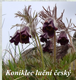
Koniklec luční český

Řekneme si podrobnosti o přírodní památce Kuzov, v případě dobré viditelnosti se "kochnem" výhledy na Lounské středohoří. Dobrodruzi si mohou najít v potoce granáty (české) a vrátíme se po žluté do Dřemčic.