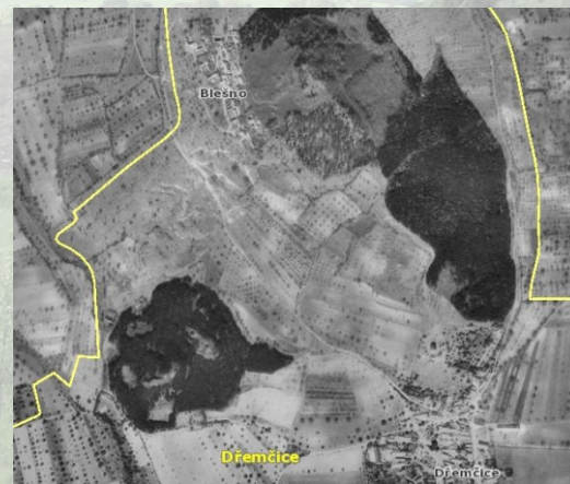
Krajina Blešenska v padesátých letech

Řekneme si podrobnosti o přírodní památce Kuzov, v případě dobré viditelnosti se "kochnem" výhledy na Lounské středohoří. Dobrodruzi si mohou najít v potoce granáty (české) a vrátíme se po žluté do Dřemčic.